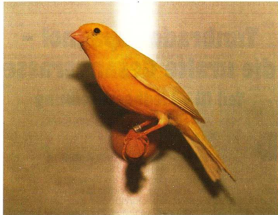
Halbintensives Weibchen. Die Brust könnte noch etwas flacher sein, die Beine kürzer. Trotz dieser Mängel erhielt der Vogel 90 Punkte bei der Deutschen Meisterschaft 1993 in Mannheim.