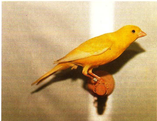
Halbintensives Weibchen, das die geforderte typische flache Haltung zeigt.