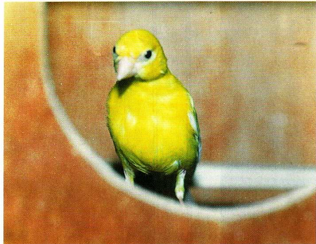
Auf diesem Bild ist der rassetypische kleine Kopf zu sehen. Der Schnabel dürfte meines Erachtens noch etwas kleiner sein.

diesem Grund ist auch ein späterer Zuchtbeginn empfehlenswert, zu früh gezogene Jungvögel mausern gelegentlich im ersten Jahr schon das Großgefieder.